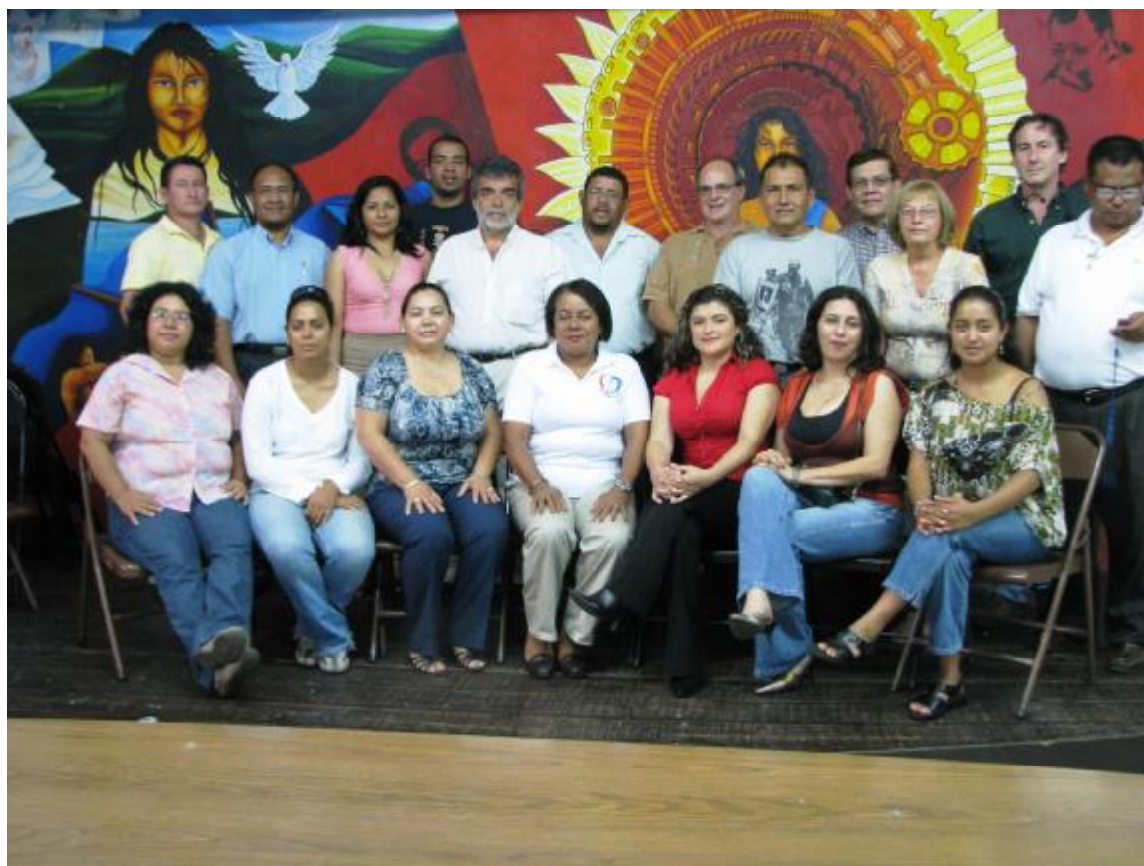
Notre délégation et les membres des fédérations honduriennes participant à la conférence de presse