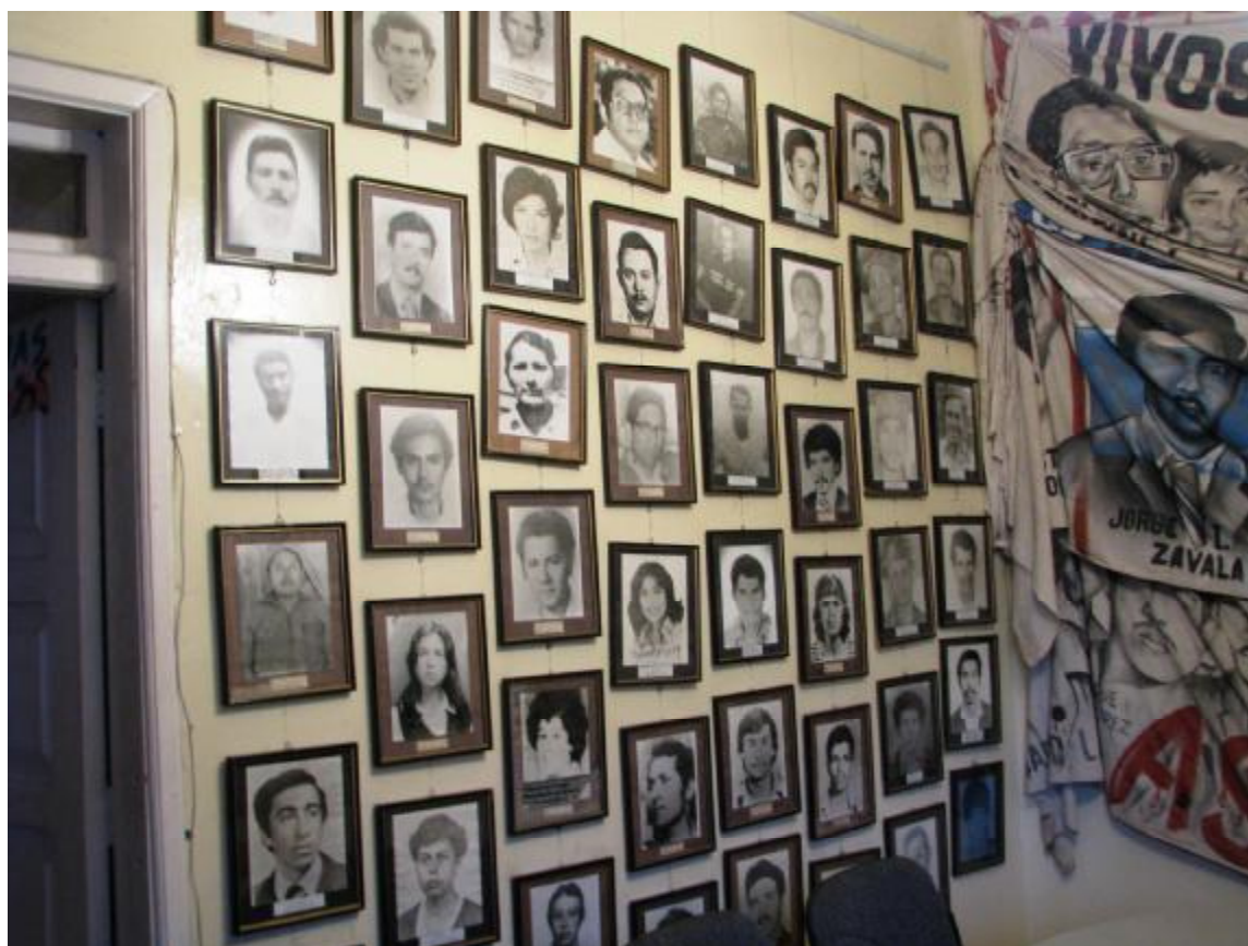
Une partie des « disparus » du Honduras

À la fin de cette journée plutôt chargée, nous avons visité les locaux de COFADEH, une organisation qui s'occupe, depuis les années 80 où les escadrons de la mort étaient très actifs, des disparitions de femmes et d'hommes du Honduras. Sur les murs des locaux, sont placardées des dizaines et des dizaines de photos de ces disparus, en indiquant leur nom, leur pays d'origine et le moment de leur disparition.