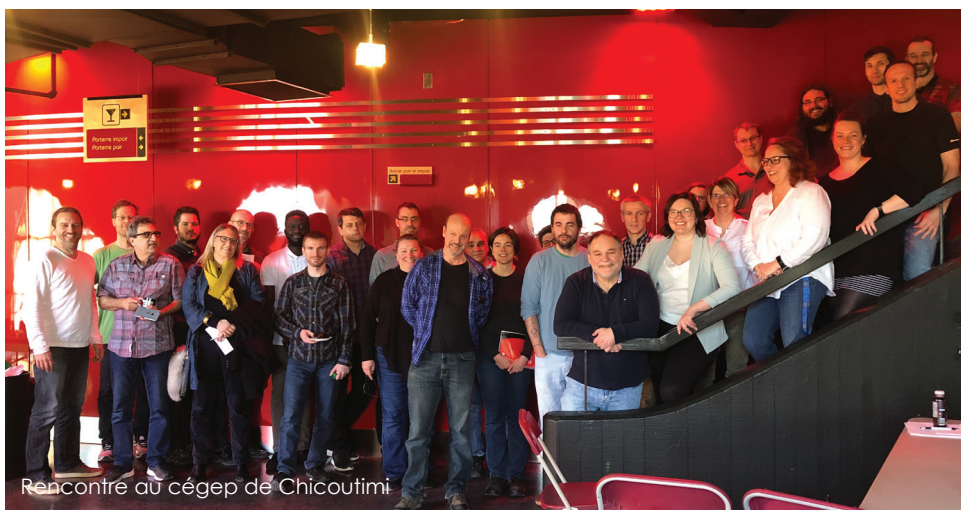
Rencontre au cégep de Chicoutimi

Cette fois-ci, vous êtes consultés sur un cahier de principes. Ce cahier de négociation présente les thématiques dont nous souhaitons discuter avec nos vis-à-vis dans le but d'agir concrètement sur les conditions de travail de milliers d'enseignantes et d'enseignants et de revaloriser le réseau collégial et notre profession. Une liste de différentes problématiques que nous vivons comme enseignantes et enseignants de cégep sera aussi adoptée par les assemblées générales d'ici le 27 septembre.